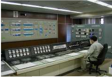
平瀬浄水場 操作室