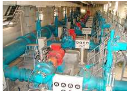
昭和浄水場 ポンプ室