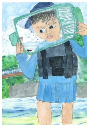
銀賞 「おたまじゃくし発見」