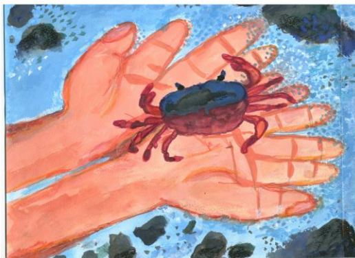
金賞 「カニをつかまえた！！」