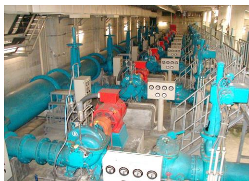
昭和浄水場 ポンプ室