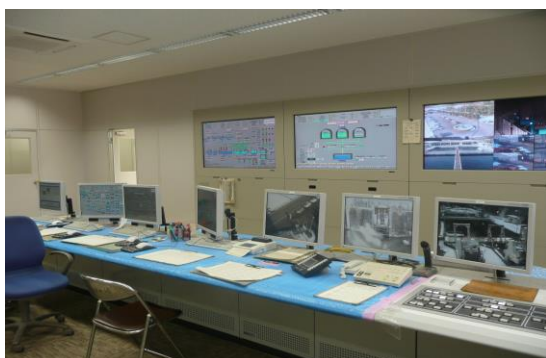
平瀬浄水場 操作室