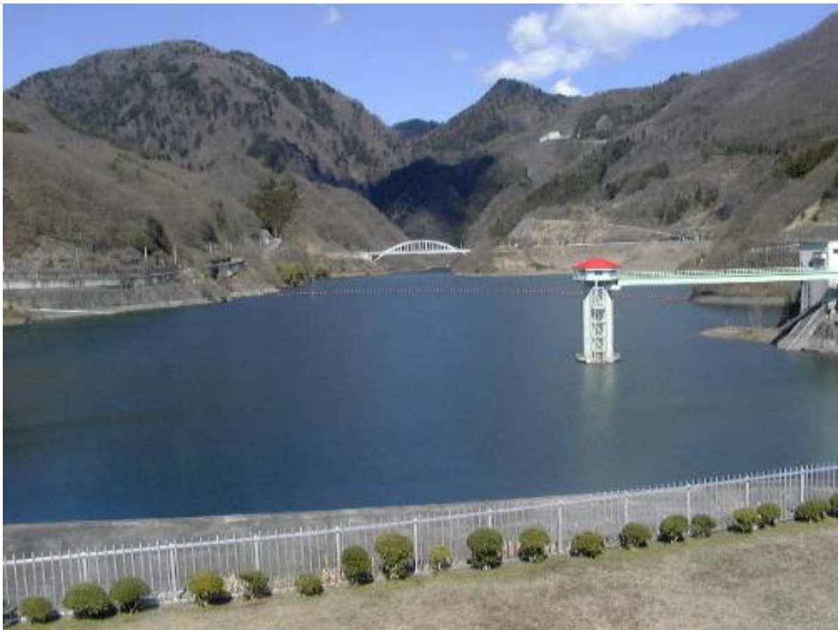
写真 荒川ダムと取水塔

水質管理の適正化を確保するために、採水地点、検査項目、検査頻度等を定め、その根拠も明記した「平成 30 年度水質検査計画」を策定いたしました。