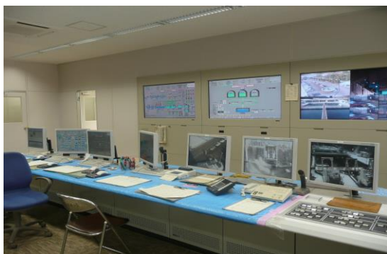
平瀬浄水場 操作室