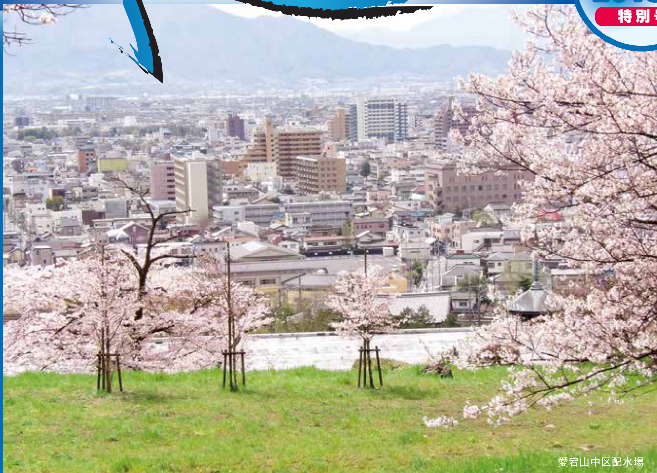
愛宕山中区配水場