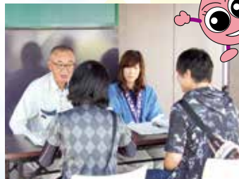
「下水道なんでも相談所」の開設

甲府市上下水道局でも、下水道に対する理解と関心を深めてもらい、下水道の普及促進を図ることを目的にイベントを実施しています。