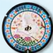
大空に飛翔する市の鳥「しらさぎ」を中心に街を彩る市の木「桜」・花「れんげ」を描いたデザイン