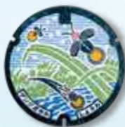
町の象徴であったゲンジボタルの復活を願い清流に舞う姿をイメージしたデザイン