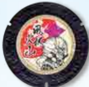
こうふ開府500年を記念したレア・デザイン 設置場所は甲府駅南口の一箇所のみ