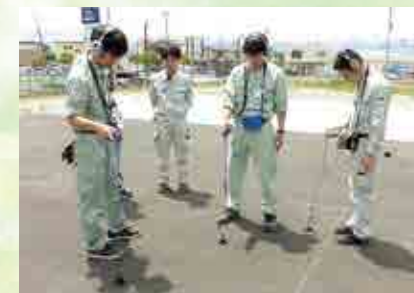
〈地下漏水調査研修の様子〉