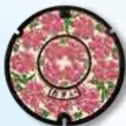
可憐で美しい花を大空に向かって開く市花「ナデシコ」をモチーフにしたデザイン