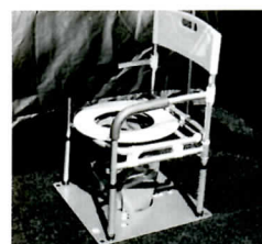
▲マンホールトイレ

ので、通常時は地上にマンホールの蓋のみが見える構造となっています。災害時には、このマンホールの蓋を外し、便器・テントを設置して使用するものです。下水道に直接流すことにより、衛生的にトイレを使用することができます。